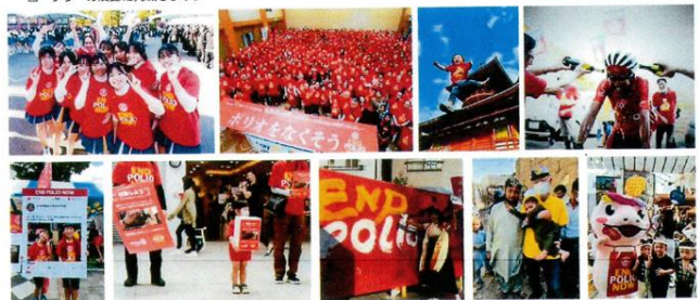
2022-23年度、2023-24年度、2024-25年度フォトコンテスト応募作品から