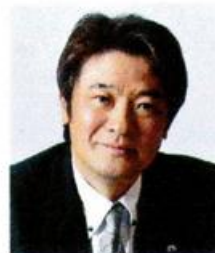
国際ロータリー第2770地区 ガバナーエレクト

このメッセージの究極の目的は、会員増強です。全世界でロータリアンの数が減っておりますので。知り合いを広めることによってロータリーが認知、理解されてクラブの繁栄に繋がるということだと思います。