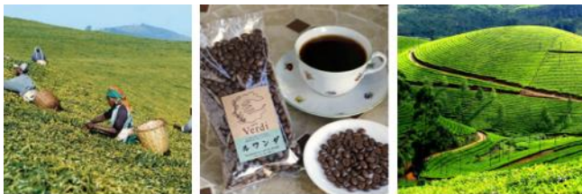
ルワンダのコーヒーと紅茶

ルワンダの料理ですが、海がないので魚があまりありません。だから牛肉が多いです。一番特別な料理は、