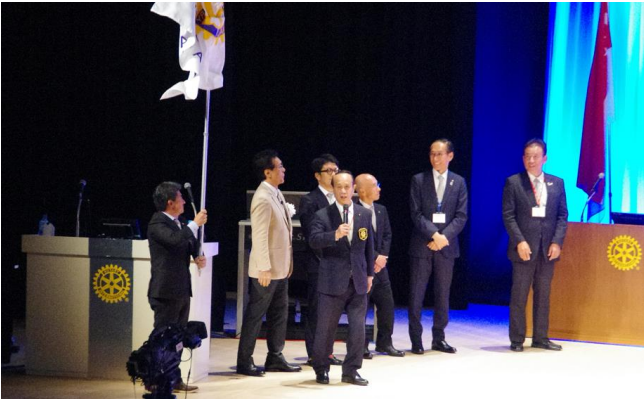
・点鐘 ・諸事お知らせ