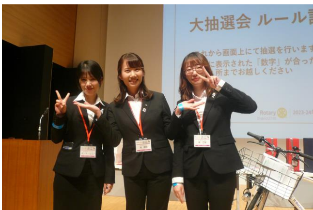
・手に手つないで ・閉宴のことば