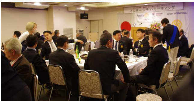
[次年度会長・幹事紹介]