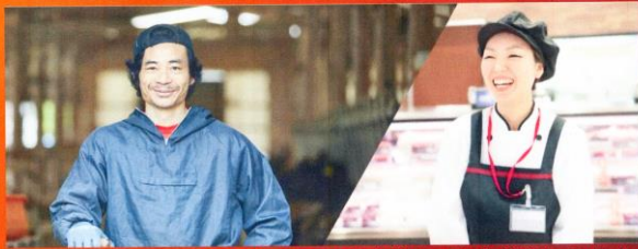
創業26年目 国産牛だけにこだわり続けています