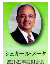
シェカール・メータ 2021-22年度RI会長