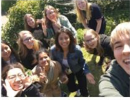
仲の良かった友人たち