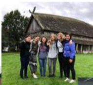
10月に行われたキャンプ