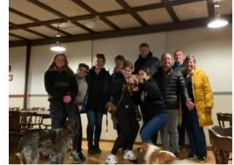
お世話になった人たち

2年前、派遣候補生だった時から幸手中央ロータリークラブの皆さんには何度も例会に呼んでいただいたりしてすごくお世話になりました。本当に感謝できません。私はこれからロータリーへの恩返しをするためにも、ローテックスとして活動していきたいと考えています。本日はありがとうございました。