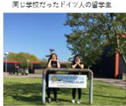
同じ学校だったドイツ人の留学生