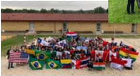
8月のイントロキャンプ