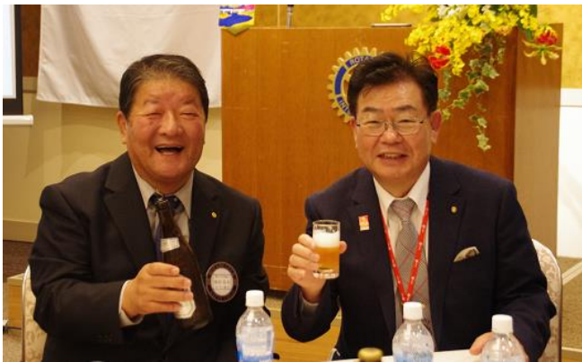
[次年度会長・幹事紹介]