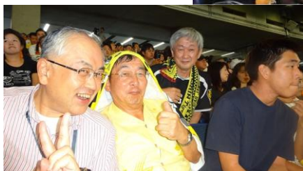
8/27 メイキャップ報告例会。