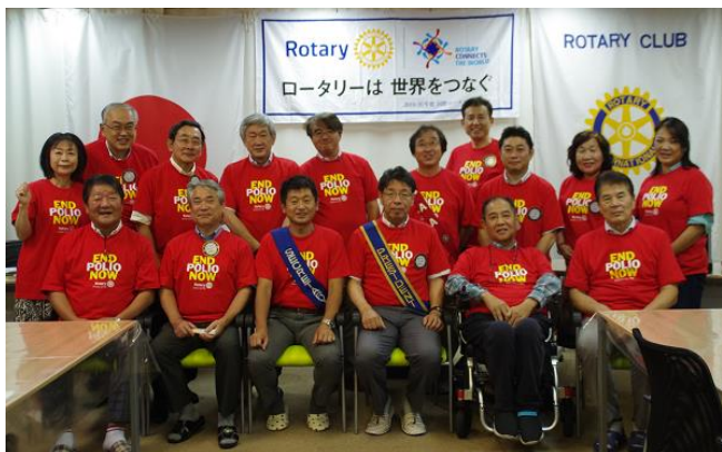
7/7 行幸湖クリーン作戦参加。その後、食事会