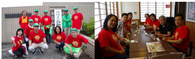
7/16 池田会員の国際大会参加報告