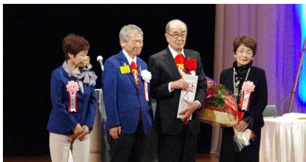
直前ガバナーご夫妻