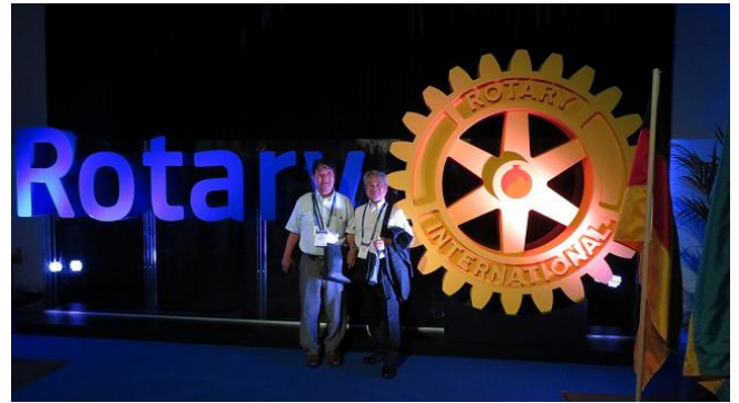
世界大会開催時 パブリックビューイング