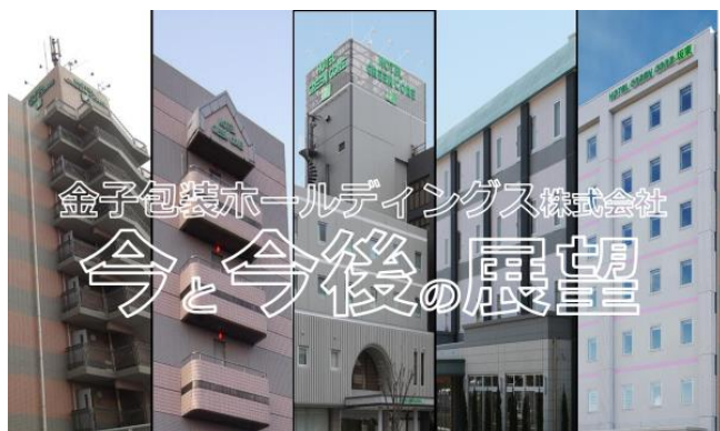
金子包装ホールディングス株式会社の今と今後の展望

ョン等を語ったことがないのでこの機会をいただいております。話をさせていただくことになりました。