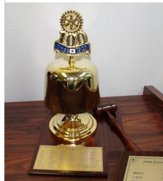
ゴールドのゴング