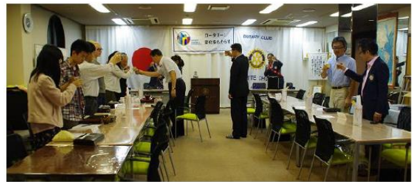
第7グループガバナー補佐 米山記念奨学生