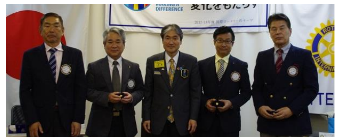
[米山記念奨学会寄付者表彰]