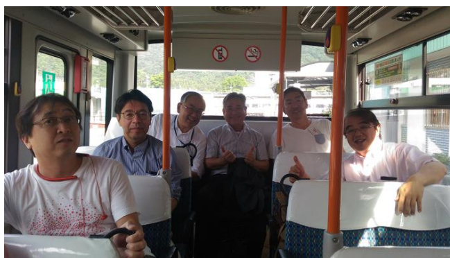
[本日の例会] 懇親会