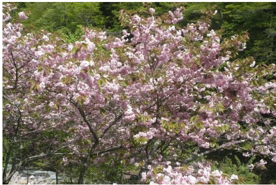
早朝から溪流釣り