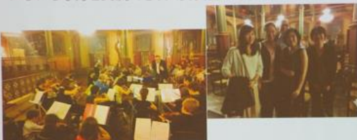
パリでのコンサートの様子