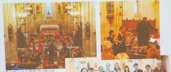
ブルゴーニュでのコンサート