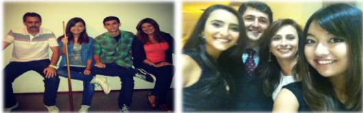
Minhas famílias brasileiras