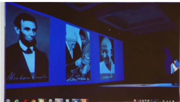
リンカーンは人間の尊厳を、マーザテレサは慈悲の心を、ガンジーは虐げられた人々に平和的な変化(Peaceful Change)を、私たちに贈ってくれました