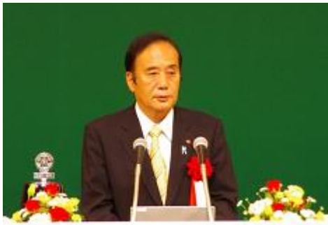
さいたま市長 清水勇人様