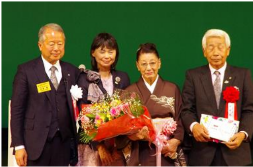
直前ガバナーご夫妻