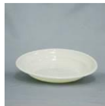
皿M (直径:220mm) ポリプロピレン製 レンタル料26円/個 在庫数:6500