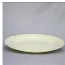
皿L (直径:270mm) ポリプロピレン製 レンタル料26円/個 在庫数:700