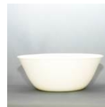
どんぶりL (直径:185mm 深さ:70mm 容量1000ml) ポリプロピレン製 レンタル料26円/個 在庫数:4500