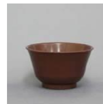
おわん(茶) (直径:107mm 深さ:60mm) ポリプロピレン製 レンタル料26円/個 在庫数:400