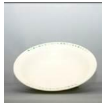
皿S深型(クリーム色) (直径:190mm) ポリプロピレン製 レンタル料26円/個 在庫数:4000