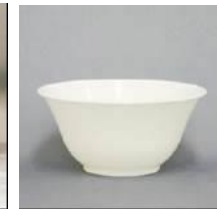
どんぶりM (直径:140mm 深さ:65mm) ポリプロピレン製 レンタル料26円/個 在庫数:2500