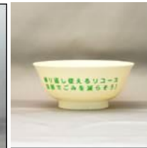
どんぶりS(クリーム色) (直径:145mm 深さ:52mm) ポリプロピレン製 レンタル料26円/個 在庫数:4000