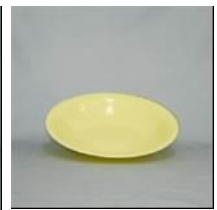
皿S (直径:190mm) ポリプロピレン製 レンタル料26円/個 在庫数:4500