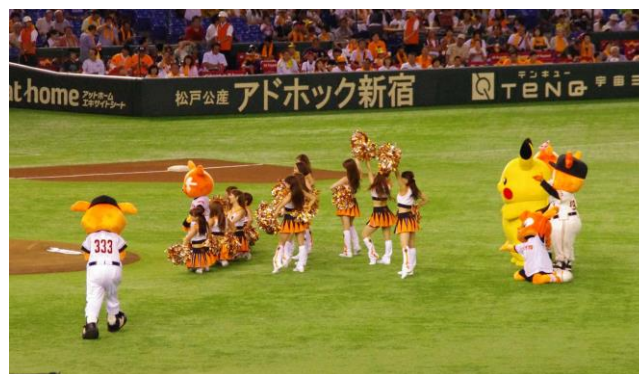
(阪神サイド応援席)